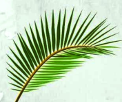
Domingo de Ramos