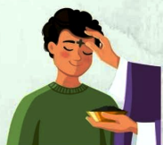
Quarta-feira de Cinzas